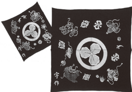
出雲の祝い風呂敷 嫁入り道具として、風呂敷の中央に 実家の家紋を描き、周囲に吉祥模様 を配しています

風呂敷の包み方は無限大。お気に入りの一枚を見つけて、風呂敷のある暮らしを楽しんでみませんか。