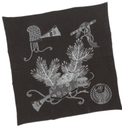
翁の面をはじめ、めでたい模様を描いた嫁入り用の風呂敷